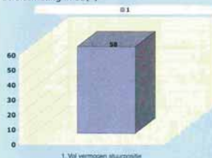
1. Vol vermogen situatie